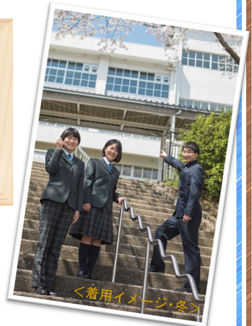
<着用イメージ・冬>