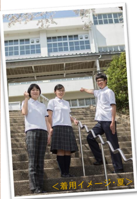
<着用イメージ・夏>