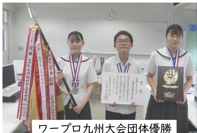
ワープロ九州大会団体優勝