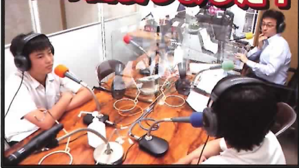
直轄エリアのコミュニティ FM ラジオ局「ちよつくらじお」にて放送中「笑う門には福来る」に出演