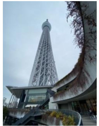
東京スカイツリー（修学旅行）