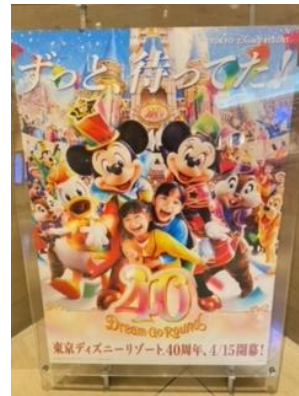
東京ディズニーランド40周年ポスター