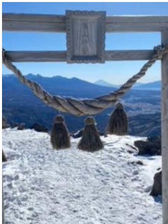
車山神宮富士山（修学旅行）