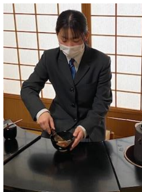
茶道部の初釜の様子